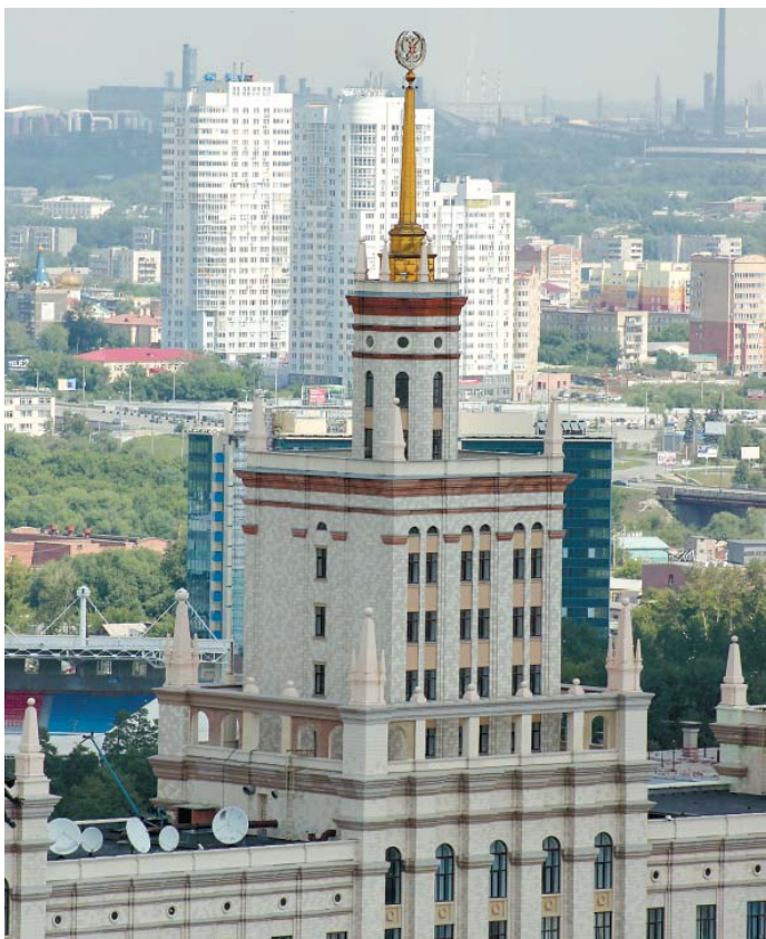
Башня главного корпуса ЮУрГУ