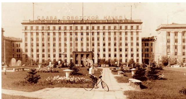
Главный корпус ЧПИ

Сергей БЕЛКОВСКИЙ, журналист, автор цикла