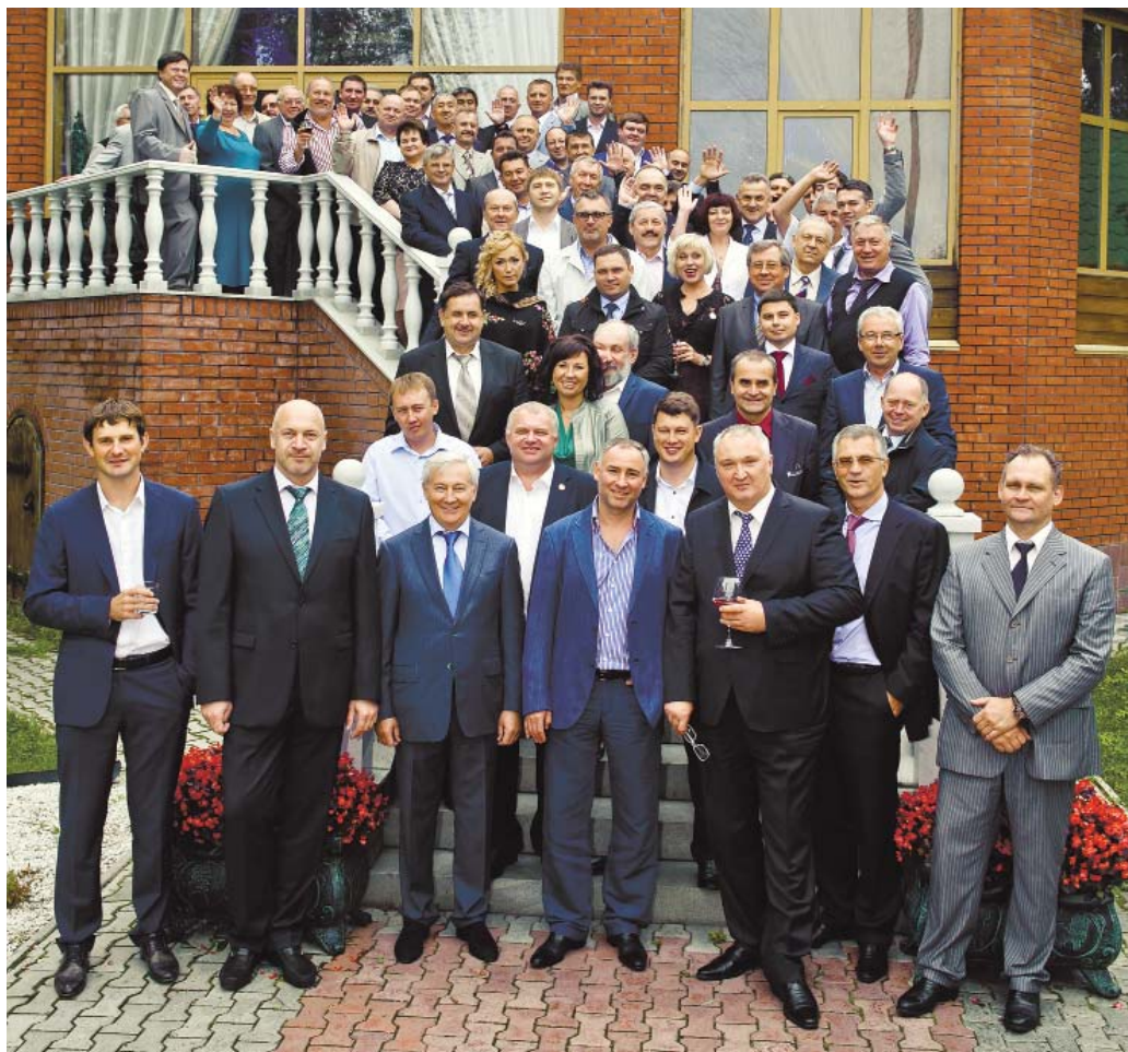
Участники торжественного мероприятия, посвященного профессиональному празднику «День строителя» (оз. Смолино, 8 августа 2013 года)

Это уникальное для Челябинска 14-этажное здание, очень непростой формы с вдавненными и треугольными элементами фасада. Все это добавляет фасаду красоты, но и строителям сложностей в исполнении. В конструкции здания применены монолитный плитный фундамент, сборно-монолитный каркас с самонесущими стенами, сплошное витражное остекление трех