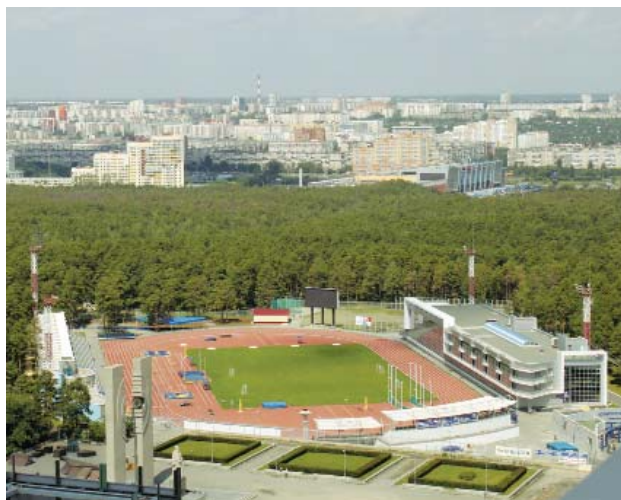
Спортивный комплекс имени Елесиной

Было время — то уже ушедшее, советское, когда все фотографии, сделанные в городе выше второго этажа, нужно было «литовать». Говоря проще, иметь разрешение цензора не только на публикацию в газете такого снимка, но и на размещение его на выставке.